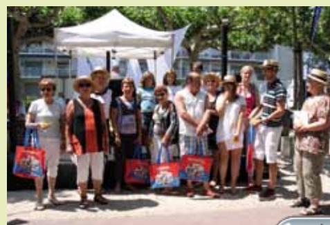
Les gagnants de la traditionnelle tombola