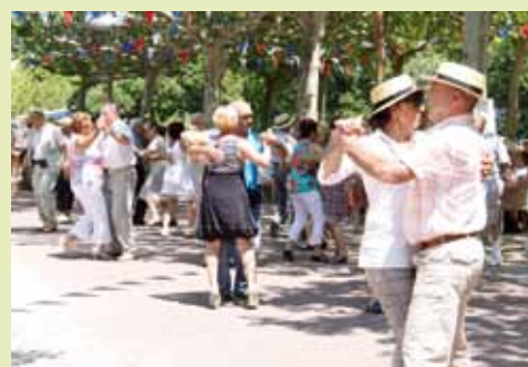
Madison et autres pas de danse...