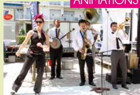
Musique et démonstrations de claquettes avec le groupe «Les Oignons»