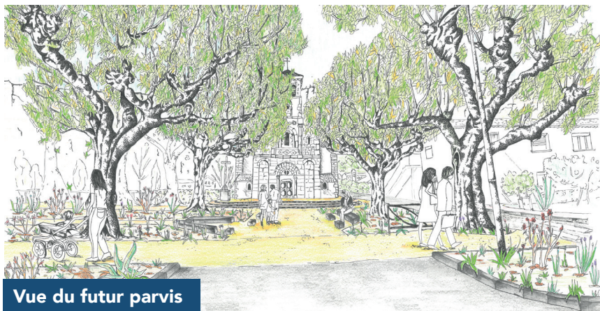
Vue du futur parvis

Enfin, une réflexion est menée avec les habitants sur le lieu où sera installé un point propreté, remplaçant ainsi la collecte en porte à porte. Ce point d'apport volontaire permettra de désencombrer les ruelles du Village des bacs de collecte et supprimer les nuisances liées au passage des camions qui en ont la charge.