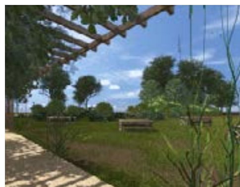
Vue de la future tonnelle

Ce nouvel aménagement du parc tiendra compte de la protection de la biodiversité mais aussi de la diminution de l'arrosage et de la préservation de l'eau, tant essentielle à notre planète.