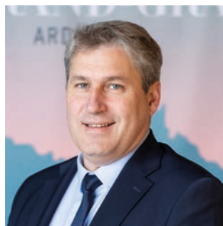
MATHIEU DARNAUD 50 ans, sénateur