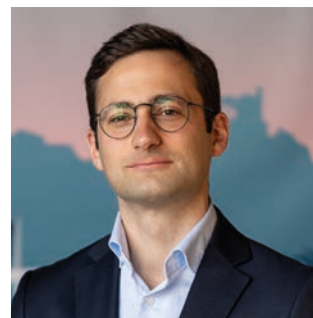
VINCENT TRÉBUCHET 37 ans, député